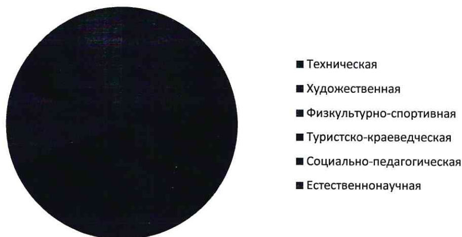
Рисунок 1. Классификация дополнительных общеобразовательных программ по направленностям дополнительного образования.

Реализация образовательной деятельности осуществляется в рамках шести направленностей, зафиксированных в лицензии учреждения. Сегодня в МАУДО «ДПШ» утверждены к реализации 289 дополнительных общеобразовательных программ. Из них художественной направленности – 141, физкультурно-спортивной направленности – 33, социально-педагогической направленности – 29, естественнонаучной – 19, туристско-краеведческой – 9, технической направленности – 58 (рисунок 1).