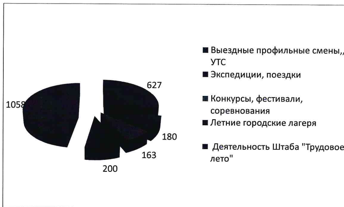
Рисунок 3. Количество участников летней оздоровительной кампании МАУДО «ДПШ» в 2019 году.

Ежегодно летом юные археологи, геологи и астрономы, художники МАУДО «ДПШ» принимают участие в экспедициях, слетах, походах и полевых лагерях, юные спортсмены в учебно-тренировочных сборах. Также обучающиеся МАУДО «ДПШ» в летние каникулы участвуют в конкурсах, фестивалях и соревнованиях.